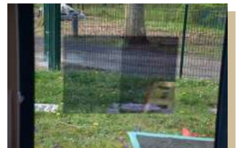
Les films occultants permettent de voir ce qu'il se passe à l'extérieur. Mais de l'autre côté, la vision est fortement altérée, car le papier réfléchit la lumière, un peu comme l'effet d'un miroir.