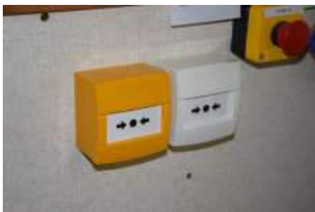
Système d'alarme différenciée, avec le boîtier jaune pour annoncer une mesure de confinement suite à un TMD. Le boîtier blanc, installé dans toutes les classes, déclenche un message d'alerte prévenant d'une intrusion.

Un budget d'environ 100.000€ HT a été attribué à ces travaux. Mais la Mairie ne sera pas seule à supporter cette dépense. La Dotation en Equipement des Territoires Ruraux (DETR) participe à hauteur de 50% des dépenses.