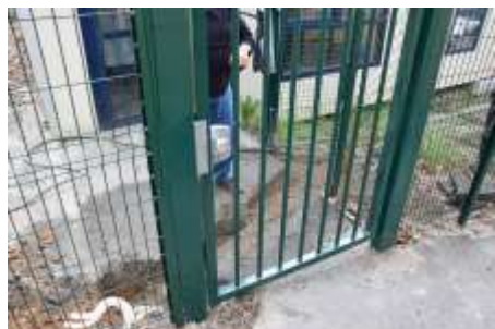
Toute la clôture a été refaite près des deux écoles. Les portillons et portails seront par la suite équipés d'un visio-phonie, permettant de mieux contrôler les entrées des visiteurs.